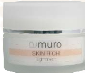
SKIN RICH Nightcream

Eine reichhaltige, regenerierende Nachtcreme mit Mandelöl, Vitamin E, Weizenkeimöl, Harnstoff, Milchsäure und Gelee Royal. Der Fett- und Feuchtigkeitsgehalt und die Regenerationsfähigkeit der Haut werden nachhaltig unterstützt. Die hochwertigen Inhaltsstoffe wirken beruhigend und glättend und sorgen für ein angenehmes geschmeidiges Hautgefühl.