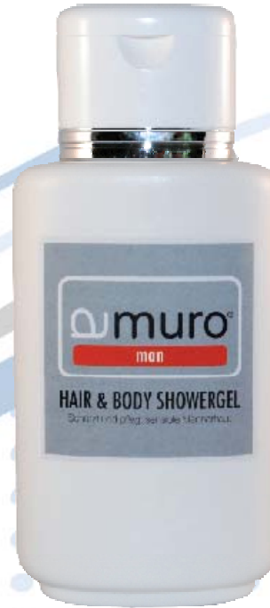
Hair & Body Showergel

Ein mit Seidenproteinen angereichertes Haar- und Körper-Shampoo. Es stimuliert und stärkt die Haar- und Hautstruktur und spendet große Mengen Feuchtigkeit. Für geschmeidige Haut und seidig glänzende Haare.