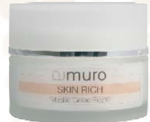
SKIN RICH Maske Gelee Royal

Eine regenerierende Maske mit Mandelöl, Vitamin E, Harnstoff und Gelee Royal für trockene und reife Haut. Gelee Royal ist besonders reich an Vitaminen und enthält neben anderen wichtigen Nährstoffen Proteine, Aminosäuren und Mineralstoffe. Die Maske wirkt glättend, feuchtigkeitsspendend und rückfettend. Ideal auch nach starker Sonnenbestrahlung.