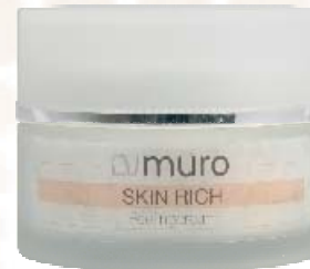
SKIN RICH Peelingcream

Mit Grünem Tee und Jojobaöl, besitzt eine feuchtigkeitsspendende Wirkung. Grüntee enthält neben anderen wichtigen Nährstoffen auch Vitamin C, Gerbstoffe, ätherische Öle und Coffein. Jojobaöl macht die Haut angenehm weich und geschmeidig. Besonders milde Peelingkörper entfernen auf sanfter Weise abgestorbene Hautzellen und verfeinern die Poren.