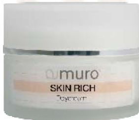
SKIN RICH Daycream

Eine geschmeidige, feuchtigkeitsspendende Tagescreme für normale und trockene Haut mit Vitamin E, Jojobaöl, Sheabutter, Honig, Harnstoff, Milchsäure und Gelee Royal. Sie wirkt beruhigend bei empfindlicher Haut und schützt vor Temperatur- und Sonneneinwirkungen (leichter UV-Schutz). Ideal als Make-up-Unterlage geeignet.