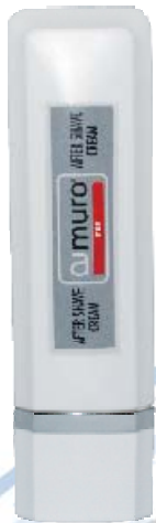
Gesichtscreme und After Shave Pflege

Mit Aloe Vera, Avocadoöl, Hyaluronsäure und den Vitaminen A und E. Diese hochwertige Creme spendet Feuchtigkeit, regeneriert, vitalisiert und festigt die Haut. Nach der Rasur ist sie wohltuend beruhigend und mindert Rötungen.